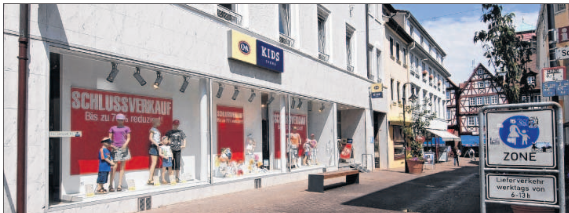
Der „Kids Store“ wird erwachsen: Das Bekleidungshaus C&A möchte den Standort Bensheim ausbauen. 1,7 Millionen Euro werden in den Umbau des Gebäudekomplexes an der Bahnhofstraße in Bensheim investiert. Eröffnung soll am 15. Februar 2008 sein.